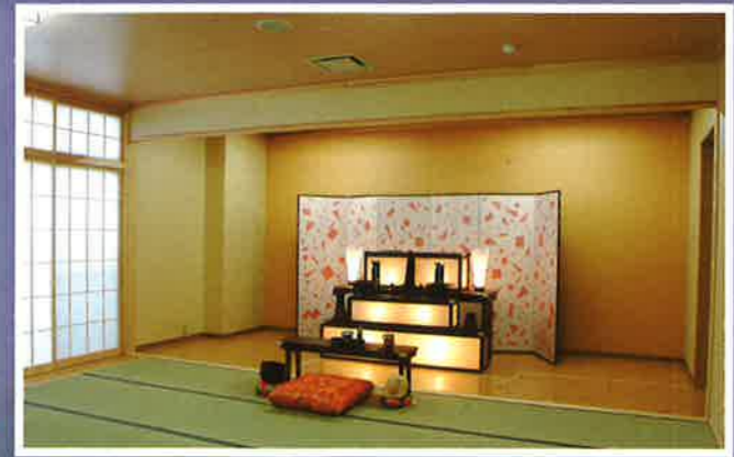
通夜・遺族控室(2室)

※祭壇は、宗旨によって多少異なります。 ※写真は一例です。御予算に応じてご相談承ります。