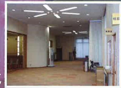
エントランス ホール

キッズルームをリニューアル 温かな色調で統一された キッズルームを一新いたしました。 お子様を見守る部屋として ご利用ください。 テレビ、おもちゃ、絵本を ご用意しております。