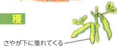
さやが下に垂れてくる