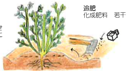
追肥 化成肥料 若干