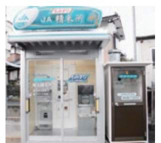
(株)JA中央サービス 農業機械課 赤碓農機事業所 湯梨浜農機センター

この度、赤碓農機事業所横と湯梨浜営農センター駐車場のコイン精米機を最新式のクボタ精米機に入れ替えています。もみ・玄米からでも高品質なワリーン白米に仕上がります。皆様のご利用をお待ちしています。