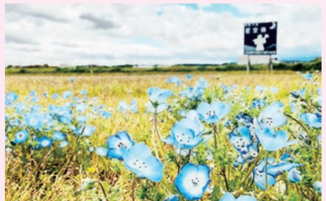
ネモフィラの花畑

琴浦町の聖郷小学校前にネモフィラの花畑が広がっています。これはJ A鳥取中央青壮年部が活動の一環として行っている“花いっぱい運動”の取り組みのひとつで、琴浦支部が育てたものです。