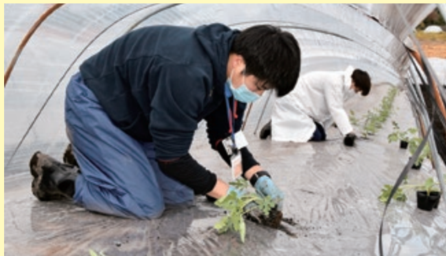
スイカの苗を定植をする新規採用職員

令和3年度新規採用職員7人が、8日間の研修を受け、新社会人として必要な礼儀・心構え、部署ごとの事業概要などを学びました。