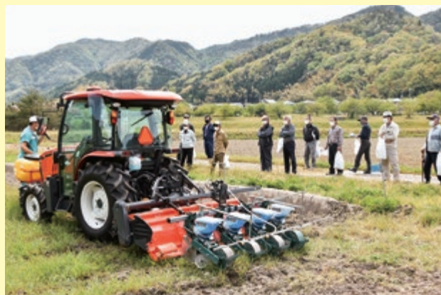
動作を確認している生産部員

J A中央サービスは三朝町で、神倉大豆生産部員を対象に株式会社中四国クボタの協力のもと、トラクター装着型の液剤散布機の実演会を行い、生産者、J A関係者ら約20人が参加しました。