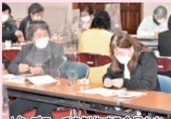
ピンブローチを制作する会員たち

JA鳥取中央女性会は、女性会専門部会を行い、JA関係者ら約60人が参加しました。一人一人の席にパーテーションを設置するなど新型コロナウイルス感染対策を充分に行ったうえで実施。初めに、令和3年度の活動計画として営農部ではりんご収穫体験、生活部では遺跡散策と道の駅の視察などの予定を発表しました。体験研修も行い「家の光」の記事を活用したコットン素材を使用したピンブローチを参加者一人一人が会員同士と親睦を深めながら思い思いの作品を制成しました。