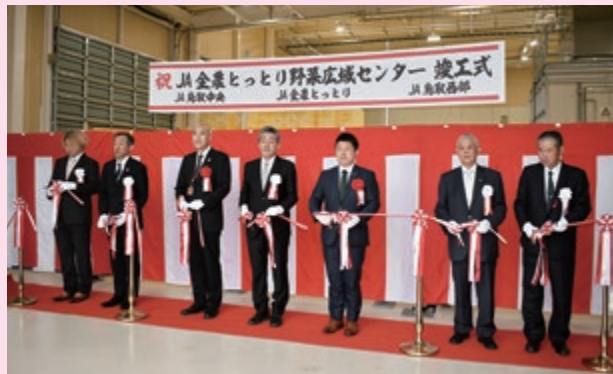
竣工式テープカットの様子

JA全農とつとりとJA鳥取中央、JA鳥取西部は共同運営する「JA全農とつとり野菜広域センター」の竣工式を行いました。