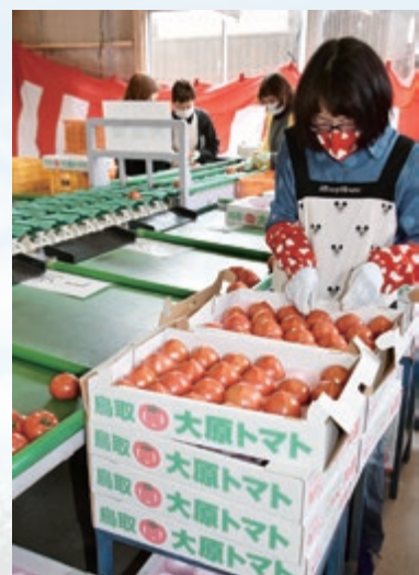
選果が始まった大原トマト

今年は6戸の農家が2万2,500箱(1箱4kg)、4,500万円の出荷、販売を目指します。